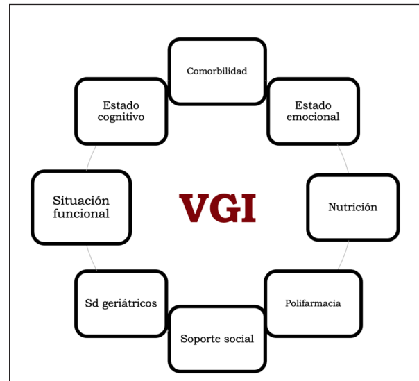
Fig. 2. Dominios de la Valoración Geriátrica Integral.

péuticas, realidad biológica del paciente y sus preferencias. Pacientes con el mismo perfil de fragilidad pueden resultar aptos para un tratamiento, pero no para otro asociado a mayor complejidad (15).