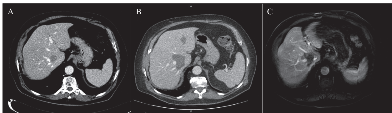
Fig. 1. Se evidencia el tratamiento de una metástasis de CCR adyacente a la vena suprahepática derecha y a la vena cava con ARF. A. Metástasis pretratamiento. B. Control vía TC a 1 mes de ARF. C. Control mediante RM a los 10 meses de ARF. Es conocido el peor rendimiento de la ARF en disposición yuxtavascular. En la figura se muestra un caso tratado por nuestro grupo del Hospital del Mar de Barcelona.

En 2012, la European Organization for Research and Treatment of Cancer (EORTC) presentó el primer estudio randomizado no retrospectivo comparando la aplicación de quimioterapia sistémica solamente, con el tratamiento con ARF y quimioterapia sistémica en 119 pacientes con enfermedad exclusivamente hepática no resecable. El estudio evidenció una tasa de superviven-